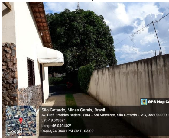
Figura 01: Espécie Mangueira ( Mangifera indica ).

Em vistoria à Av. Prefeito Erotides Batista, Nº 1100, Bairro Nossa Sra Aparecida, neste município, no dia 04 de março de 2024, conforme solicitado no Requerimento Nº 010/2024 SISAM, foi constatado que no interior da propriedade existe 01 (uma) árvore de grande porte da espécie Mangueira (Nome Científico: Mangifera indica ) , para a qual solicita o corte . Segue o registro fotográfico no momento da vistoria.